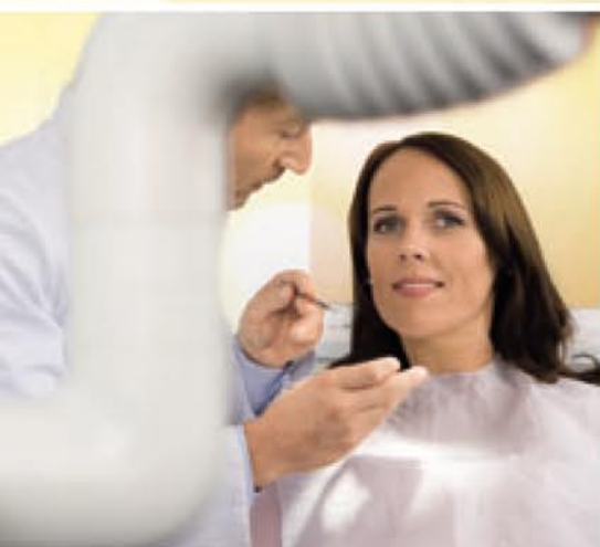
Y alegrarse del excelente resultado.